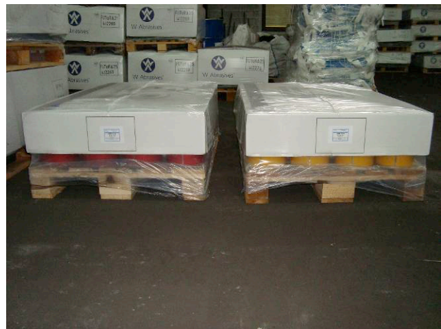
판지 카버 와 밀착 포장을 갖고 있

W Abrasives 는 Winoagroup 의 브랜드입니다. 더 자세한 정보를 위해서 아래를 참고하세요.