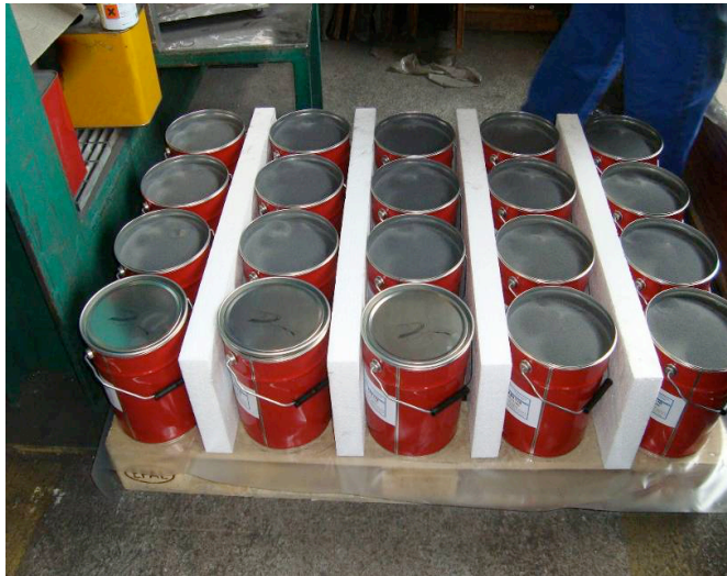
500 kg EPAL 팔레트에 실린 폴리스틸렌 칸막이가 있는