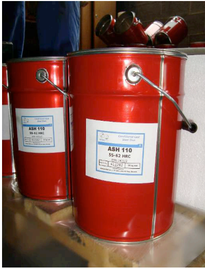
라벨 과 손잡이가 있는 25Kg 원뿔 형 캔 25kg

새로운 포장 과 상표는 이전의 포장과 상표를 가지고 있는 재고 소진됨에 따라 시장에 모습을 보이게 될 것입니다.